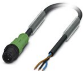
Sensor-/Aktor-Kabel, 3-polig, PUR halogenfrei, schwarzgrau RAL 7021, Stecker gerade M12, Kodierung: A, auf freies Leitungsende, Kabellänge: 10 m, mit Kunststoffrändel

Bitte beachten Sie, dass die hier angegebenen Daten dem Online-Katalog entnommen sind. Die vollständigen Informationen und Daten entnehmen Sie bitte der Anwenderdokumentation. Es gelten die Allgemeinen Nutzungsbedingungen für Internet-Downloads. ( http://phoenixcontact.de/download )