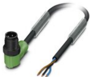
Sensor-/Aktor-Kabel, 3-polig, PUR halogenfrei, schwarzgrau RAL 7021, Stecker gewinkelt M12, Kodierung: A, auf freies Leitungsende, Kabellänge: 3 m, mit Kunststoffrändel

Bitte beachten Sie, dass die hier angegebenen Daten dem Online-Katalog entnommen sind. Die vollständigen Informationen und Daten entnehmen Sie bitte der Anwenderdokumentation. Es gelten die Allgemeinen Nutzungsbedingungen für Internet-Downloads. ( http://phoenixcontact.de/download )